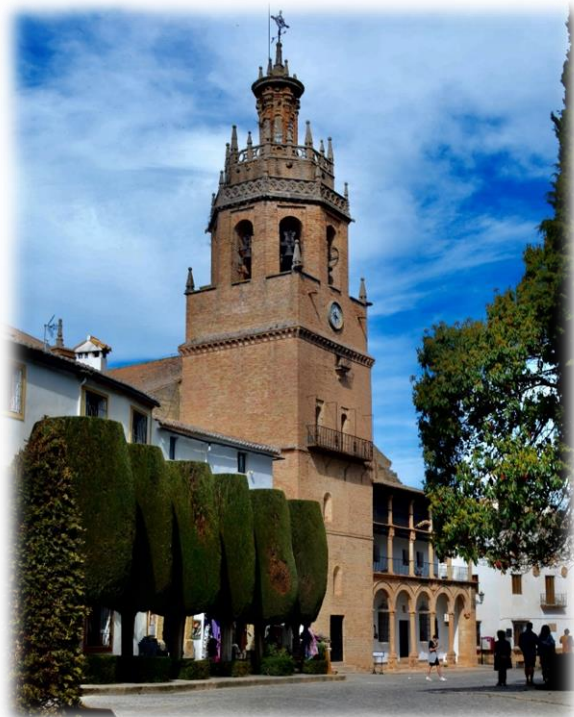
De pelgrimsroute Via Serrana passeert eveneens langs Ronda. Deze route is 150 km lang, start in Gibraltar om aansluiting te vinden op de Via de la Plata in Sevilla.