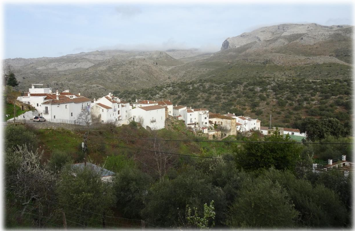
Voor de wandeling voor vandaag verplaatsen we ons naar het witte dorpje Parauta. Dit dorpje in Andalusië heeft zijn herkomst in de Moorse tijd.