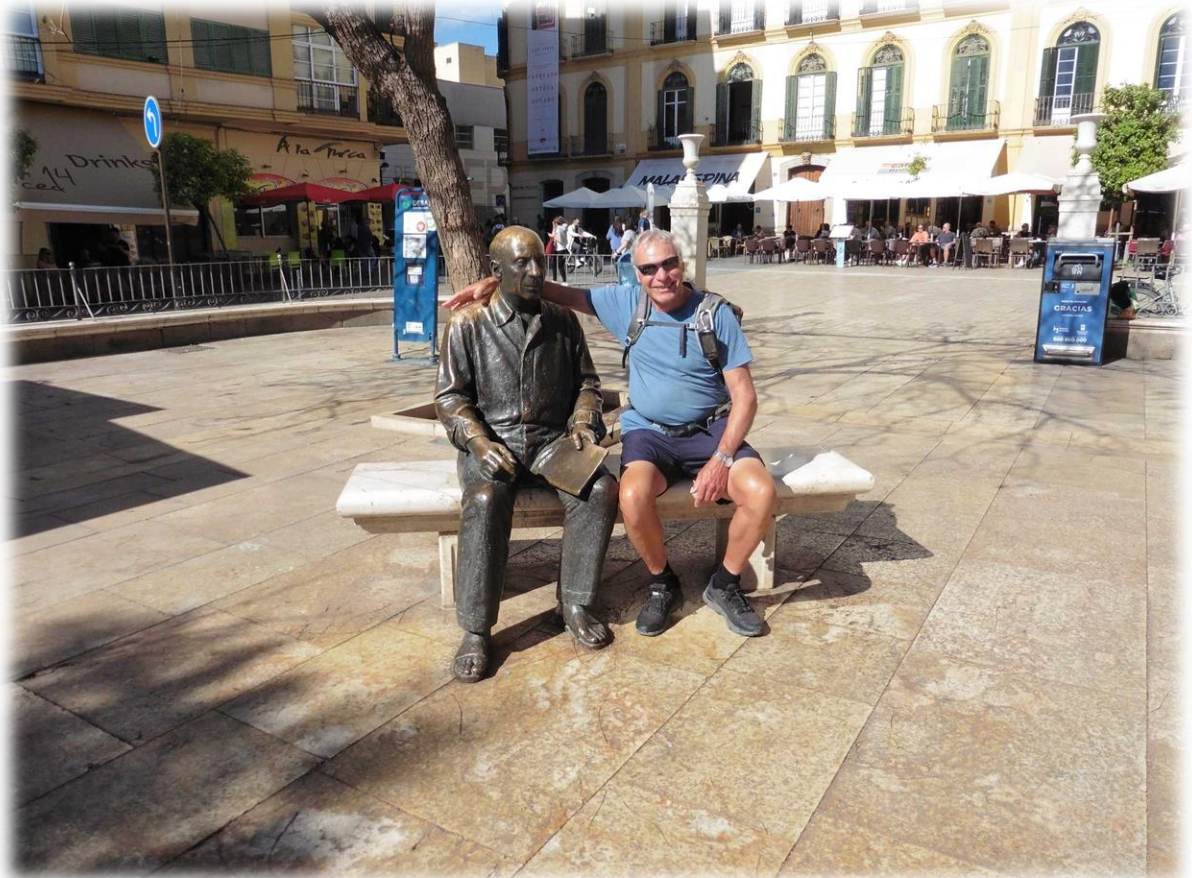
Het bronzen standbeeld van Pablo Picasso staat opgesteld op een plein in de buurt van zijn geboortehuis.