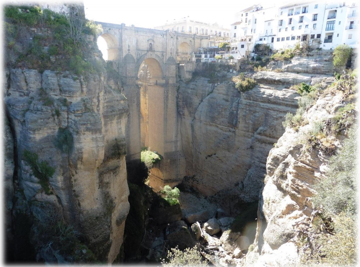
Ronda is ook bekend voor zijn drie bruggen, de Romeinse brug, de oude of Arabische brug en de nieuwe brug. De onderste foto is de “nieuwe brug”.