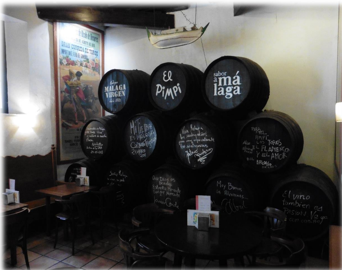
We doen ook nog een wandeling doorheen de stad Málaga.