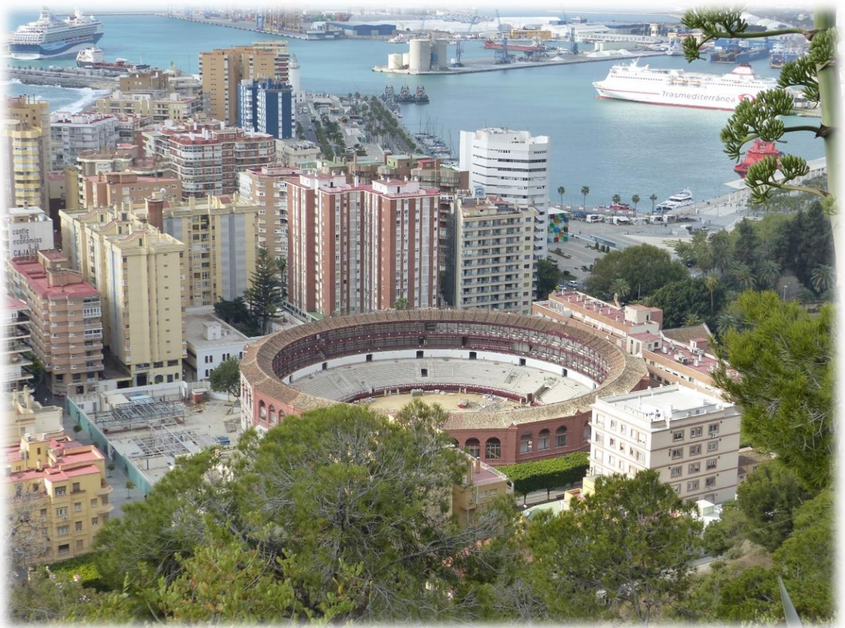
De stierenvechtersarena van Málaga werd gebouwd in 1876 en biedt plaats aan 9.000 toeschouwers. Je kan er vrij in en uit wandelen.