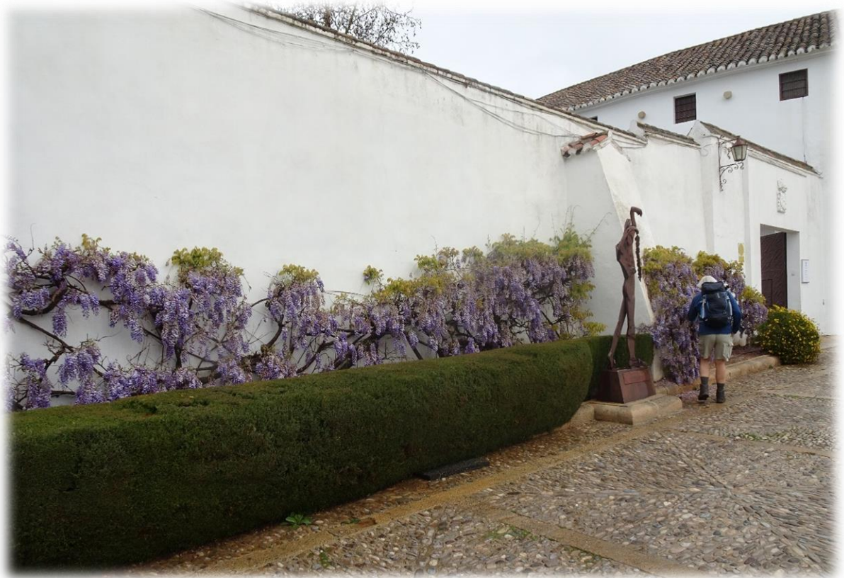
Na de verplaatsing naar Ronda bezoeken we de stad.